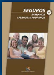
Seguros Ramo Vida e Planos de Poupança