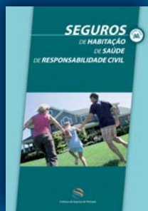
Seguros de Habitação / de Saúde / de Responsabilidade Civil