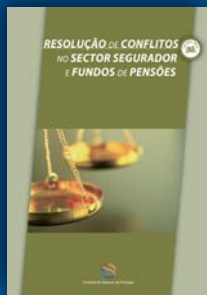
Resolução de Conflitos no Sector segurador e Fundos de Pensões