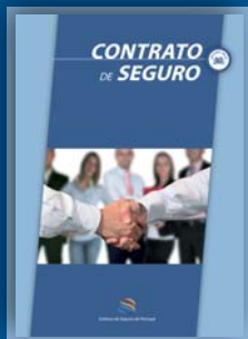
Contrato de Seguro